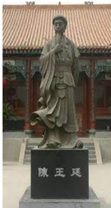
Chen Wang Ting